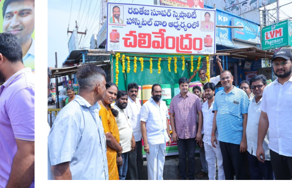
సామాజిక సేవా కార్యక్రమాలను బాధ్యతగా తీసుకుని సేవలు అందిస్తున్న రాతలను ఈ సందర్భంగా ఆయన అభినందించారు. ఈ కార్యక్రమంలో కూటమి పార్టీల నాయకులు, కార్యకర్తలు పాల్గొన్నారు.