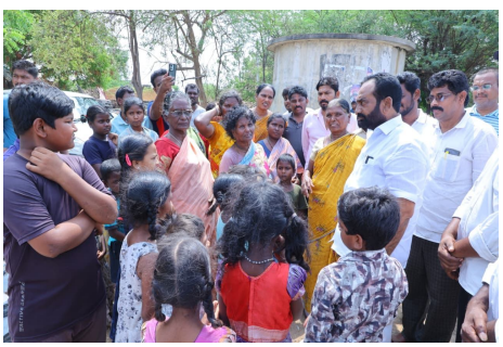
పనుల ప్రతిపాదనలపై మున్సిపల్ అధికారులతో చర్చించారు.

జన సముద్రం న్యూస్, పల్నాడు జిల్లా ప్రతినిధి, మే 06