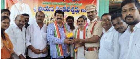
అశ్యాపురం మండలంలో మండల పార్టీ అధ్యక్షులతో ఎమ్మెల్యే బద్దే వేడుకలు