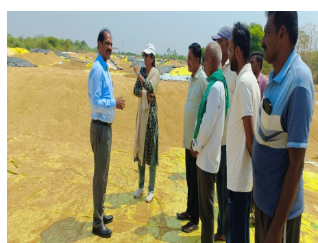
కేంద్రాలకు తీసుకురావాలని, రైతుల సౌకర్యార్థం కొనుగోలు కేంద్రాలలో త్రాగునీరు, నీడ, తూకం యంత్రాలు, ప్యాడి క్లీనర్లు ఇతర సదుపాయాలు కల్పించాలని తెలిపారు. రైతు వివరాలను సిస్టం లో నమోదు చేసి ఆధార్ కార్డు ద్వారా వారి గుర్తింపును దృవీకరించాలని, రైతు భూమి విస్తీర్ణం, పండించిన ధాన్యం వివరాలను పరి చూడాలని, ధాన్యం నాణ్యత ప్రమాణాలకు అనుగుణంగా ఉండే విధంగా పరిశీలించాలని తెలిపారు. ఈ కార్యక్రమంలో సంబంధిత అధికారులు తదితరులు పాల్గొన్నారు.