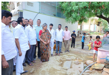
దృష్టికి తీసుకురావాలని కోరారు. కూటమి ప్రభుత్వంలో ఏ విద్యార్థి విద్యకు దూరం కాకుండా, బడి వీడిన పిల్లలను పాఠశాలలో చేర్చించేందుకు భవిష్యత్తులో అన్నీ రకాల చర్యలు తీసుకుంటామని హామీ ఇచ్చారు.