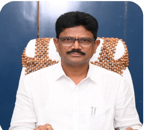
తెలిపారు. మంచిర్యాల జిల్లాలోని మంచిర్యాల మున్సిపల్ కార్పొరేషన్, బెల్లంపల్లి, క్యాతనపల్లి, చెన్నూర్, లక్ష్మీపేట మున్సిపాలిటీల పరిధిలో 45

వేల 863 దరఖాస్తులు రాగా 5 వేల 97 దరఖాస్తులను ఆమోదించడం జరిగిందని, 1 వేలు 723 దరఖాస్తులను తిరస్కరించడం జరిగిందని, 39 వేల 43 దరఖాస్తులు పెండింగ్ లో ఉన్నాయని తెలిపారు. జిల్లాలోని గ్రామపంచాయతీలలో 10 వేల 742 దరఖాస్తులు రాగా, 7 వేల 674 మంది దరఖాస్తుదారులకు రుసుము చెల్లింపు కొరకు లేఖలు జారీ చేయడం జరిగిందని, 2 వేల 402 దరఖాస్తుదారులు రుసుము చెల్లించగా 1 వేలు 58 మంది దరఖాస్తుదారులకు ప్రాసీడింగ్ జారీ చేయడం జరిగిందని తెలిపారు. దరఖాస్తుదారులు సంబంధిత మున్సిపల్ కార్పొరేషన్/మున్సిపల్ కార్యాలయం/గ్రామపంచాయతీ కార్యాలయాలలో సంప్రదించాలని, ప్రభుత్వం కల్పించిన అవకాశాన్ని సద్వినియోగం చేసుకోవాలని తెలిపారు.