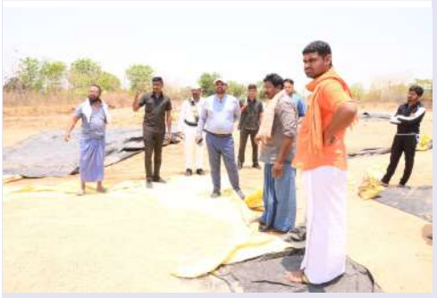
జైపూర్ మండలంలోని వరి కొనుగోలు కేంద్రాల పరిశీలన,