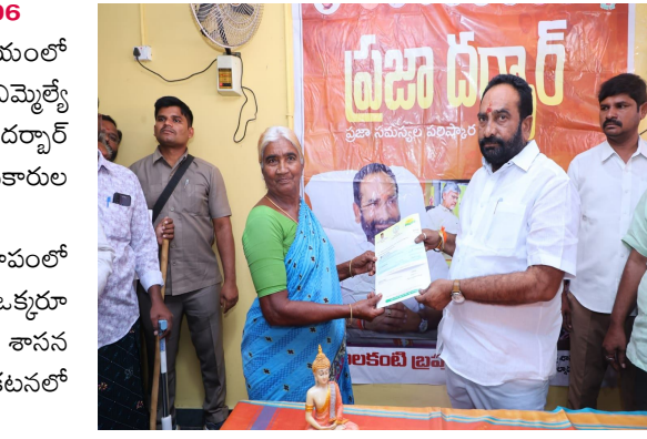
మండల కేంద్రంలోని ఎంపీడీవో కార్యాలయంలో గురువారం ఉదయం 10.30 నిమిషాలకు ఎమ్మెల్యే జూలకంటి బ్రహ్మానందరెడ్డి ఆధ్వర్యంలో ప్రజాదర్శార్ నిర్వహించబడుతోంది. నియోజకవర్గ స్థాయి అధికారుల సమన్వయంతో నిర్వహించే ఈ ప్రజాదర్శార్ కార్యక్రమంలో ప్రజా సమస్యలను అర్జీల రూపంలో నేరుగా ఎమ్మెల్యే స్వీకరించి పరిశీలిస్తారు, ప్రతిబక్షరూ ఈ కార్యక్రమాన్ని సద్వినియోగపరుచుకోవాలని శాసన సభ్యుల వారి కార్యాలయం బుధవారం ఓ ప్రకటనలో కోరింది.

పట్టణంలోని రింగ్ రోడ్డులో రవివేణు హాస్టల్లో ప్రజాదర్శార్, బస్టాండ్ సెంటర్ నందు టీడీపీ యువ నాయకులు షేక్.మోసీన్ ఆధ్వర్యంలో ప్రజల దాహోర్చి తీర్చేందుకు నూతనంగా ఏర్పాటు చేసిన రెండు