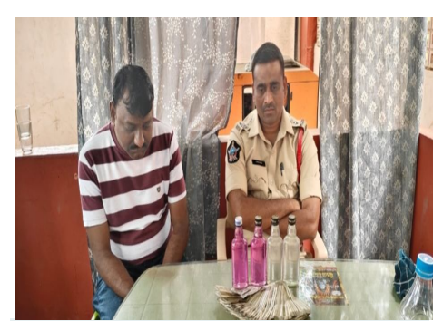
- ప్రేమ పెళ్ల చేసుకోవాలంటే లంచం ఇవ్వాలంటే - తాడేపల్లిగూడెం ఎస్పి, వింఠ ప్రతిపాదన - కానిస్టేబుల్ ద్వారా రాయబారం