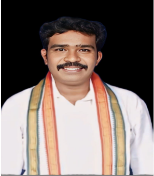
ఎల్కాతుర్ మే 15(జనసముద్రం)

విమర్శించారు. ఎన్నికల సమయంలో ప్రజలకు ఇచ్చిన హామీలను మరచిపోయి, పన్నుల రూపంలో ప్రజల నుంచి అధికంగా డబ్బులు వసూలు చేయడమే కేంద్ర ప్రభుత్వ లక్ష్యంగా మారిందన్నారు. ఇంధనంపై విధిస్తున్న అధిక ఎత్తైన సుంకాల వల్లే పెట్రోల్, డీజిల్ ధరలు అమాంతం పెరుగుతున్నాయని పేర్కొన్నారు. వెంటనే ఇంధన ధరలను తగ్గించి ప్రజలకు ఉపశమనం కల్పించాలని డిమాండ్ చేశారు. ప్రజల సర్వేషం కంటే ఆదాయ వనరులపైనే కేంద్ర ప్రభుత్వం దృష్టి పెట్టడం బాధాకరమన్నారు.