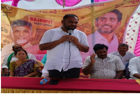
ఒంటిమిట్ట జనసముద్రం న్యూస్, మే 15: