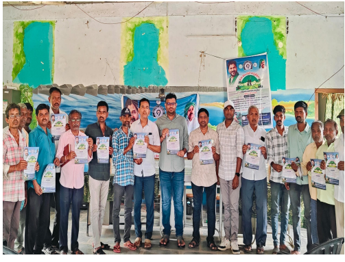
ఎల్కాతుర్ మే 15.(జనసముద్రం)