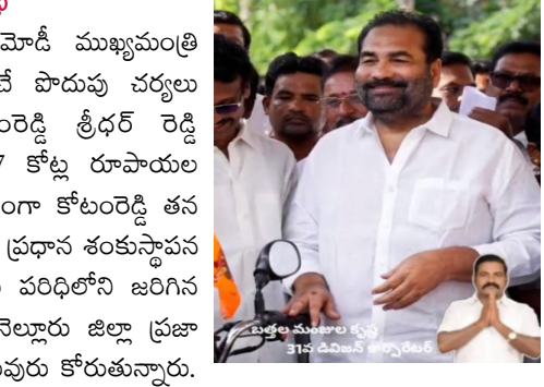
నెల్లూరు, మే 15, జనసముద్రం జిల్లా ప్రతినిధి