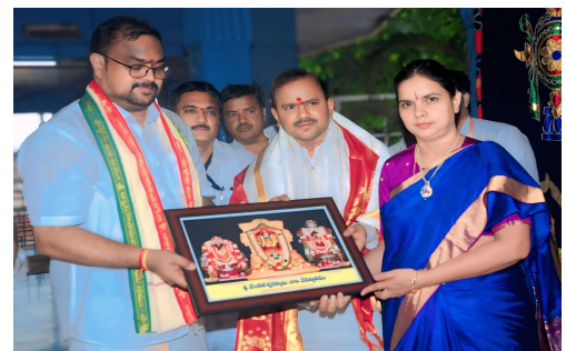
జనసముద్రం స్టాఫ్ ఏలూరు జిల్లా మే 16

ప్రముఖ పుణ్యక్షేత్రమైన ద్వారకా తిరుమల శ్రీ వెంకటేశ్వర స్వామి వారి ఆలయానికి ఆంధ్రప్రదేశ్ ప్రభుత్వం రెవెన్యూ