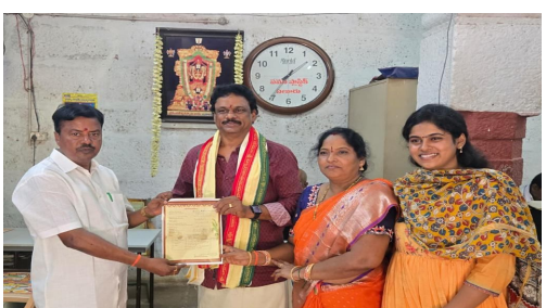
బ్రాండ్ ప్రతాన్ని అందజేశారు.