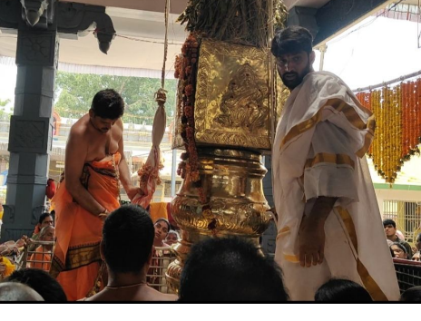
నెల్లూరు, మే 18, జన సముద్రం జిల్లా ప్రతినిధి. బుచ్చిరెడ్డిపాలెం మండలం జొన్నవాడలో పినాకసి నిధి