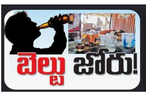
యథేచ్ఛగా దొరుకుతుంది. బెల్ల షాపుల పై ప్రత్యేక కఠినం రేపటి మీ జనసముద్రం.

జనసముద్రం న్యూస్ పామర్రు నియోజకవర్గ ప్రతినాది, మే.18 ముడుపుల మత్తులో ఎక్కితే శాఖ పెదపారుపూడి మండలం లో (అక్రమ మద్యం విక్రయాలు) హవా విచ్చలవిడిగా కొనసాగుతోంది. నిబంధనలను తుంగలో తొక్కి వీధి వీధినా, బడ్డీ కొట్లలో, ఇళ్లలో రహస్యంగా ఈ మద్యం విక్రయాలు జోరుగా సాగుతున్నాయి. సమయంతో నిమిత్తం లేకుండా ప్రభుత్వ వైస్ షాపులు ఉదయం 10 నుంచి రాత్రి 10 గంటల వరకు మాత్రమే తెరిచి ఉంటాయి. కానీ, బెల్ల షాపుల్లో మాత్రం ఉదయం 5 గంటల నుంచే అర్ధరాత్రి దాటే వరకు మద్యం