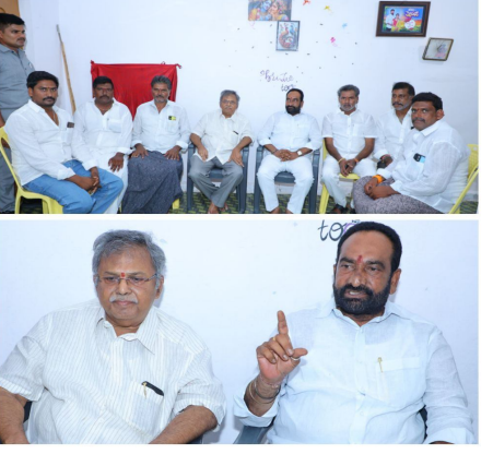
- ప్యాటెన్ లో నిర్దించే అజ్ఞానికి ప్రశ్నించే హక్కు లేదు..!! - ఎమ్మెల్యే జాలకంటి బ్రహ్మానందరెడ్డి ధ్వజం..

గ్రామంలోని ప్రజా వేదిక సమావేశ ప్రాంగణానికి చేరుకుని, ఉదయం 10.15 గంటల నుండి మధ్యాహ్నం 12.10 గంటల వరకు నిర్వహించే “మత్స్యకారుల సేవలో” కార్యక్రమంలో పాల్గొంటారు. తరువరి మధ్యాహ్నం 12.45 గంటలకు తుమ్మలపెంటలో ఏర్పాటు చేసిన ఇంటరాక్టివ్ వేదిక వద్ద మత్స్యకారులతో ముఖాముఖ సమావేశంలో పాల్గొంటారు. అనంతరం మధ్యాహ్నం 1.30 గంటలకు పార్టీ కేడర్ సమావేశ వేదికకు చేరుకుని, మధ్యాహ్నం 3.00 గంటల వరకు పార్టీ కేడర్ సమావేశంలో పాల్గొంటారు. అనంతరం మధ్యాహ్నం 3.15 గంటలకు తుమ్మలపెంట హెలిప్లాన్ నుండి హెలికాప్టర్లో బయలుదేరి, చిత్తూరు జిల్లాకు వెళ్తారు. జిల్లా కలెక్టర్ ఆ ప్రకటనలో తెలిపారు.