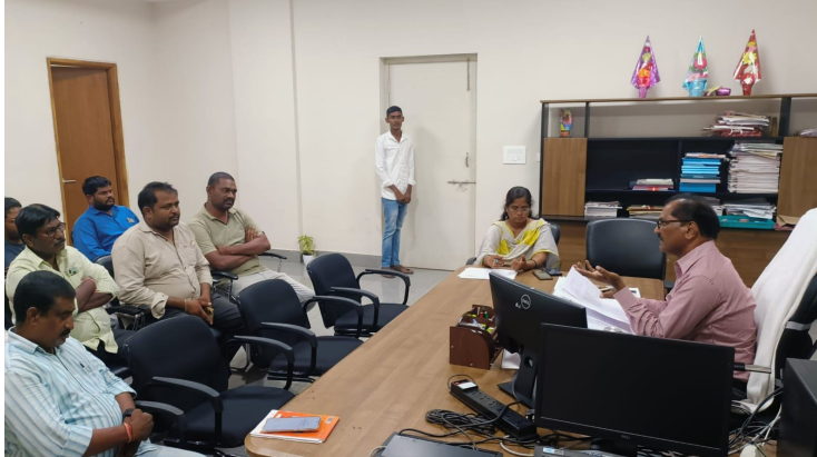
జనసముద్రం న్యూస్ మంచిర్యాల జిల్లా ప్రతినిధి సిరిపురం మధుకర్ మే 20, 2026: మంచిర్యాల

జిల్లాలో ప్రభుత్వ నిబంధనల ప్రకారం కొనుగోలు చేసిన పరి ధాన్యం రవాణా కు సరిపడా లారీలను కేటాయించాలని మంచిర్యాల జిల్లా అదనపు కలెక్టర్ (రెవెన్యూ) వి.రాములు అన్నారు. బుధవారం జిల్లా కేంద్రంలోని సమీకృత జిల్లా కార్యాలయాల భవన సముదాయంలోని జిల్లా అదనపు కలెక్టర్ (రెవెన్యూ) ఛాంబర్ లో జిల్లా పౌరసంరక్షణ శాఖ జిల్లా మేనేజర్ శ్రీకేశ తో కలిసి రవాణా లారీల గుర్తీదారులతో సమావేశం నిర్వహించారు. ఈ సందర్భంగా జిల్లా అదనపు కలెక్టర్ (రెవెన్యూ) వి. రాములు, మాట్లాడుతూ కొనుగోలు చేసిన పరి ధాన్యాన్ని తరలింపుకు సరిపడా లారీలను కేటాయించాలని, కొనుగోలు చేసిన ధాన్యాన్ని కేటాయించిన ప్రకారం రైస్ మిల్లులు, గోదాములకు త్వరితగతిన తరలించి ధాన్యం దిగుమతి చేగంగా ఆయ్యేలా చూడాలని తెలిపారు. దిగుమతికి అవసరమైన హామీల సంఖ్య పెంచుకోవాలని తెలిపారు. ధాన్యం దిగుమతి ప్రక్రియ వేగవంతం చేసి జిల్లాలో కొనుగోలు ప్రక్రియను ఎలాంటి ఆటంకం లేకుండా పూర్తి చేసేలా చర్యలు తీసుకోవాలని తెలిపారు.ఈ కార్యక్రమంలో సంబంధిత అధికారులు తదితరులు పాల్గొన్నారు.