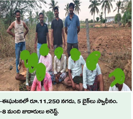
-ఈ ఘటనలో రూ.11,250 నగదు, 5 బైక్లు స్వాధీనం. -8 మంది జుదారులు అరెస్ట్.