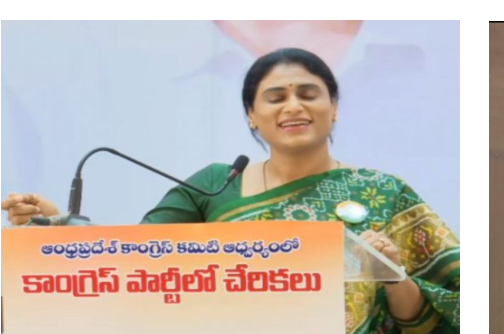
నెల్లూరు, మే 20, జనసముద్రం జిల్లా ప్రతినిధి.

ముహూనేత వైయస్ రాజశేఖర్ రెడ్డి గారిని ఆదర్శంగా తీసుకొని నాలాగా చాలామంది యువత రాజకీయాల్లోకి వచ్చారు. ఎన్నో వేల కుటుంబాలను తన సంక్షేమం ద్వారా అడుగు ముఖ్యమంత్రి వైయస్ రాజశేఖర్ రెడ్డి రాష్ట్రం విడిపోయిన తర్వాత వైయస్సార్ కాంగ్రెస్ పార్టీలో 12 సంవత్సరాలు పార్టీ జెండా మోస్తూ,వైయస్సార్ కాంగ్రెస్ పార్టీ పార్టీ కోసం పనిచేసే కార్యకర్తల అభిప్రాయాన్ని ఏనాడు పరిగణించే తీసుకోలేదు.కార్యకర్తల మనోవేదనే వైయస్సార్ కాంగ్రెస్ పార్టీ షోర్ పతనానికి కారణమైంది.వైసీపీ చేసే ద్రామాలు చూస్తున్న ప్రజలు నమ్మే పరిస్థితిలో లేరు.నాడు - నేడు పధకం ద్వారా బదులకు రంగులు వేశారు కానీ, పిల్లలకు