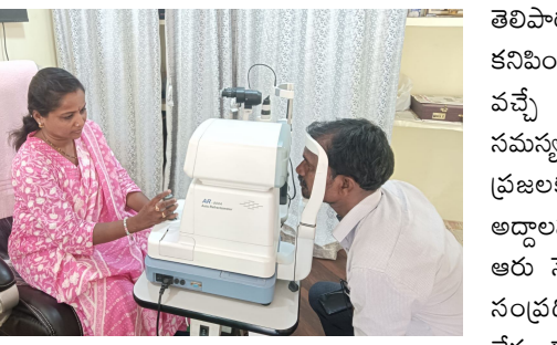
ఫైల్ సెంటర్ వన్ ముత్తుకూరు