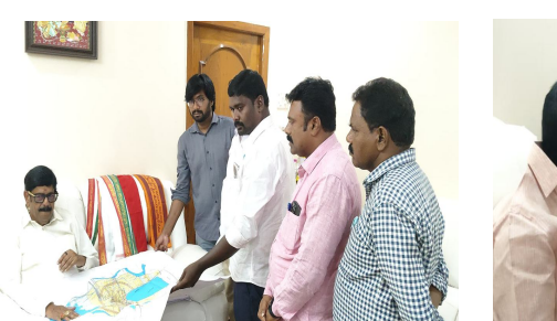
మాస్టర్ ప్లాన్ రూపొందించాలని అధికారులకు సూచించాం : మంత్రి ఆనం రామనారాయణరెడ్డి