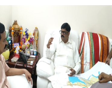
ఆదేశించాం మంత్రి ఆనం రామనారాయణరెడ్డి