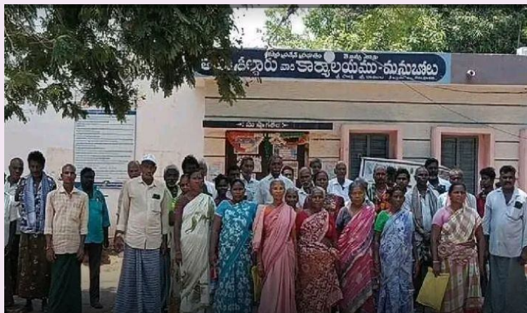
నెల్లూరు, మే 20, జనసముద్రం జిల్లా ప్రతినిధి.

మనుబోలు మండలంలోని పూడూరి పాలెం లో ఓ వ్యక్తి రొయ్యలు సాగు చేస్తున్నాడు. దీంతో సమీప రైతులు ఇబ్బందులకు గురి అవుతున్నారు. తాసిల్దార్ కార్యాలయం ఎదుట రైతులు ఆందోళన చేశారు. 150 ఎకరాల్లో రొయ్యలు సాగు చేయడంతో నేల సారం తగ్గి తమ పొలాల్లో పంట సరిగా పడటం లేదని వారు వాపోయారు. వెంటనే చర్యలు తీసుకోవాలని వారు తాసిల్దార్ని కోరారు. అధికారులు ఏమి చర్యలు తీసుకుంటారు, రైతులకు ఎలా న్యాయం చేస్తారు వేచి చూడాలి.