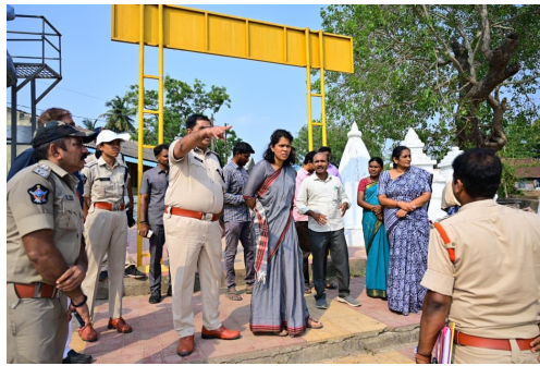
దేవాస్థాన ఘాట్ ను పరిశీలిస్తున్న కలెక్టర్ మరియు ఎస్పీ