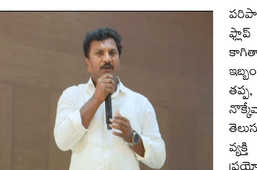
విద్యను అందించేందుకు అవసరమైన ఉపాధ్యాయులను నియమించలేదు. పిల్లల భవిష్యత్తును అగమ్య గోచరంగా మార్చేశారు.ఉచితంగా వైద్య విద్య అందించేందుకు ప్రభుత్వ మెడికల్ కళాశాలలను స్థాపించిన వ్యక్తి మహూనేత వై.యస్. రాజశేఖర్ రెడ్డి మెడికల్ కళాశాలలో మేనేజ్యంట్, ఎన్నారై కోటాను ప్రవేశపెట్టిన వ్యక్తి వైయస్ జగన్మోహన్ రెడ్డి నేడు ప్రభుత్వ మెడికల్ కళాశాలల ప్రైవేటీకరణ పేరిట వైసీపీ నాయకులు ద్రామాలు ఆడుతున్నారు. - అధికారంలోకి వస్తే డీజిల్, పెట్రోల్ ధరలు పెంచమన్న వైసీపీ, కూటమి పార్టీలు అధికారంలోకి వచ్చిన తర్వాత రేట్లు పెంచాయి. పక్క రాష్ట్రాలతో పోల్చుకుంటే డీజిల్, పెట్రోల్ ధరలు మన రాష్ట్రంలో పది రూపాయలు ఎక్కువ. - కూటమి ప్రభుత్వం

ముహూనేత వైయస్ రాజశేఖర్ రెడ్డి గారిని ఆదర్శంగా తీసుకొని నాలాగా చాలామంది యువత రాజకీయాల్లోకి వచ్చారు. ఎన్నో వేల కుటుంబాలను తన సంక్షేమం ద్వారా అడుగు ముఖ్యమంత్రి వైయస్ రాజశేఖర్ రెడ్డి రాష్ట్రం విడిపోయిన తర్వాత వైయస్సార్ కాంగ్రెస్ పార్టీలో 12 సంవత్సరాలు పార్టీ జెండా మోస్తూ,వైయస్సార్ కాంగ్రెస్ పార్టీ పార్టీ కోసం పనిచేసే కార్యకర్తల అభిప్రాయాన్ని ఏనాడు పరిగణించే తీసుకోలేదు.కార్యకర్తల మనోవేదనే వైయస్సార్ కాంగ్రెస్ పార్టీ షోర్ పతనానికి కారణమైంది.వైసీపీ చేసే ద్రామాలు చూస్తున్న ప్రజలు నమ్మే పరిస్థితిలో లేరు.నాడు - నేడు పధకం ద్వారా బదులకు రంగులు వేశారు కానీ, పిల్లలకు