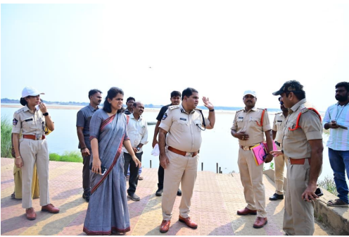
ముగ్గుళ్ళ వూజారి రేవును పరిశీలిస్తున్న అధికారులు

సమయంలో ట్రాఫిక్ నియంత్రణ, భద్రత, అత్యవసర సేవల నిర్వహణకు పోలీసు శాఖ తరఫున ప్రత్యేక కార్యవర్గం రూపొందిస్తామని తెలిపారు. ఈ కార్యక్రమంలో ఎమ్మార్వోస్