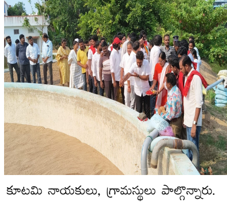
కూటమి నాయకులు, గ్రామస్థులు పాల్గొన్నారు.

గ్రామానికి సురక్షిత త్రాగునీరు అందించే దిశగా జల్ జీవన్ మిషన్ కార్యక్రమం ద్వారా విస్తృతంగా పనులు చేపడుతున్నామన్నారు. నియోజకవర్గంలోని గ్రామాల్లో ఓవర్ హెడ్ ట్యాంకుల నిర్మాణం, పైప్ లైన్ వ్యవస్థల ఏర్పాటు, వాటర్ ఫిల్టర్ బెడ్ల మరమ్మత్తులు, త్రాగునీటి సరఫరా మెరుగుదల వంటి అనేక అభివృద్ధి కార్యక్రమాలు కొనసాగుతున్నాయని తెలిపారు. ఈ కార్యక్రమంలో భీమడోలు మండల జనసేన, డి.పీ.వీ, బీ.జే.పీ మండల అధ్యక్షులు, గ్రామ అధ్యక్షులు, ప్రజాప్రతినిధులు, సంబంధిత శాఖ అధికారులు,