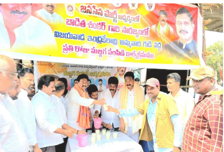
అందించారు. ఈ సందర్భంగా ఆయన మీడియాతో మాట్లాడుతూ ప్రజలకు సేవ చేస్తూ, ప్రజా సమస్యలను పరిష్కరించే కార్యకర్తలను నాయకులుగా