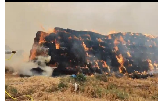
-వరి కొయ్యలకు నిప్పు పెట్టి దుర్మరణం, -పశుసంపదకు తీవ్ర నష్టం

అల్పతుర్తి, మే 26(జనసముద్రం) హనుమకొండ జిల్లా అల్పతుర్తి మండలం వీరనారాయణపూర్ గ్రామంలో వరి కొయ్యలకు నిప్పు పెట్టడం వల్ల పర్యావరణానికి, రైతులకు, పశుసంపదకు తీవ్ర నష్టం కలుగుతుందని గ్రామస్థులు ఆందోళన వ్యక్తం చేశారు. పొలాల్లో మిగిలిన వరి కొయ్యలను కాల్యడం వల్ల భూమి నిరాన్ని పెంచే నూత్నజీవులు నశించి, నేల ఉరుకుదనం తగ్గిపోతుందని తెలిపారు. అదేవిధంగా కొయ్యలను కాల్చినప్పుడు వెలువడే పొగ కారణంగా గాలి కాలుష్యం పెరిగి ప్రజలకు శ్వాస సంబంధిత వ్యాధులు