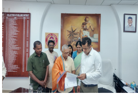
నెల్లూరు, మే 26, జనసముద్రం జిల్లా ప్రతినిధి.