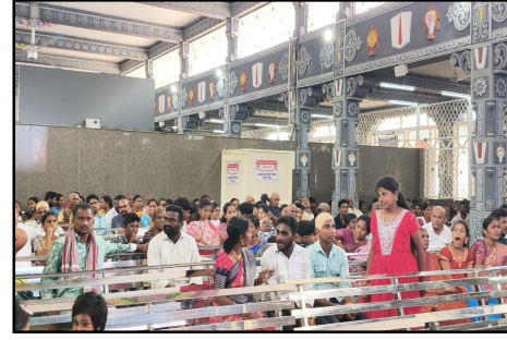
నూతన క్యూ కాంప్లెక్స్ లో వేచి ఉన్న భక్తులు.

జనసముద్రం న్యూస్ ఏలూరు జిల్లా మే 27 ద్వారకాతిరుమల ప్రతీనిధి ప్రముఖ పుణ్యక్షేత్రమైన ద్వారకాతిరుమల శ్రీ వేంకటేశ్వర స్వామి వారి అలయానికి వచ్చే భక్తులకు ఇకపై స్వామివారి దర్శనం మరింత సుఖవంతం కానుంది. రూ. 12.50 కోట్ల వ్యయంతో నిర్మించిన అత్యాధునిక శాశ్వత క్యూ కాంప్లెక్స్ ను దేవస్థానం అధికారులు బుధవారం ఉదయం నుంచి భక్తుల కోసం పూర్తిస్థాయిలో అందుబాటులోకి తీసుకువచ్చారు. భక్తులు క్యూలో వేచి ఉండే సమయాన్ని సౌకర్యవంతంగా మార్చేందుకు ఈ కాంప్లెక్స్ లో అధునాతన వసతులను కల్పించారు. ఇందులో మొత్తం 6 కంపార్ట్ మెంట్లు ఉన్నాయి. మొత్తం కంపార్ట్ మెంట్ లో 4500 మంది భక్తులు హాయిగా కూర్చునేలా స్టీల్ బల్కన్లు ఏర్పాటు చేశారు. ప్రతి కంపార్ట్ మెంట్ లో 5 సీట్ కెమెరాలు, భక్తులకు స్వామివారి వైభవాన్ని, నిత్య కైంకర్యాలను తెలియజేసేలా క్యూ కాంప్లెక్స్ హాల్ లో పెద్ద ఎత్తున వీడియో వాల్ స్ ను ఏర్పాటు చేశారు. దీనివల్ల భక్తులు భక్తిభావంతో స్వామివారిని స్మరించుకుంటూ సమయాన్ని గడపవచ్చు మరియు సెంట్రలైజ్డ్ సౌండ్ సిస్టమ్ ను అందుబాటులోకి తెచ్చారు. వేసవి