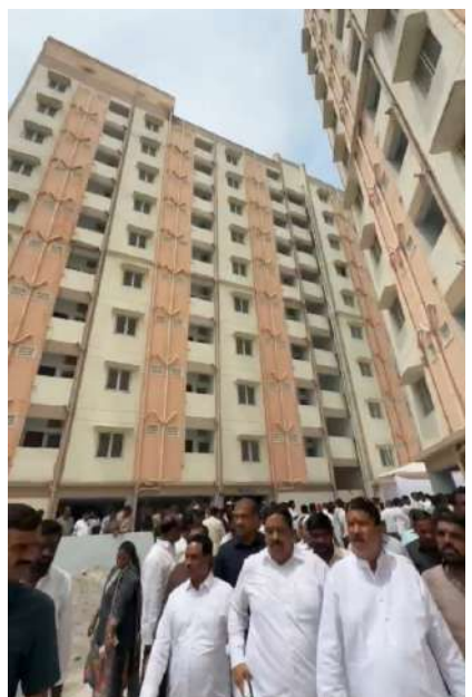
రూమ్ ఇళ్లను నిర్మించే సమయంలో స్థానిక గ్రామస్థులు అడ్డుపడగా వారికి పది శాతం ఇళ్లను కేటాయించామని హామీ ఇవ్వడం జరిగిందని వారికి కూడా ఇల్లు మంజూరు చేయాలని కోరారు. కుకట్నల్లి నియోజకవర్గం పరిధిలో పనిచేస్తున్న విలేజ్ కలకలకు గతంలో ఇళ్ల స్థలాల పట్టాలు జారీ