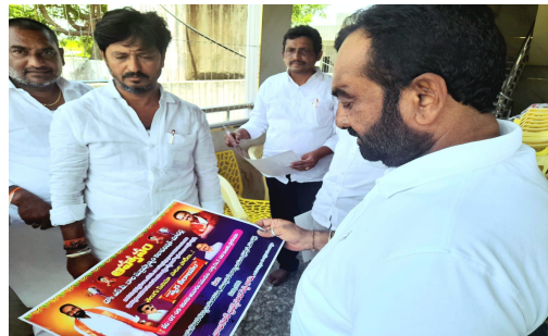
- గొప్ప గాయకుడు బాలసుబ్రహ్మణ్యం ఎమ్మెల్యే జాలకంటి.. - స్వర్ణ సీరాజం పాస్పర్లను ఆవిష్కరించిన ఎమ్మెల్యే జాలకంటి..