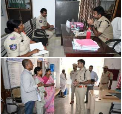
ప్రజలు ప్రస్తుత ఎండ తీవ్రత దృష్ట్యా తగిన జాగ్రత్తలు తీసుకోవాలని సూచించారు. అనంతరం పోలీస్ అధికారులతో సమావేశమై ఎస్పీ మాట్లాడుతూ, యువతను గంజా పంటి మత్తు పదార్థాల బారిన పడకుండా కాపాడాల్సిన బాధ్యత