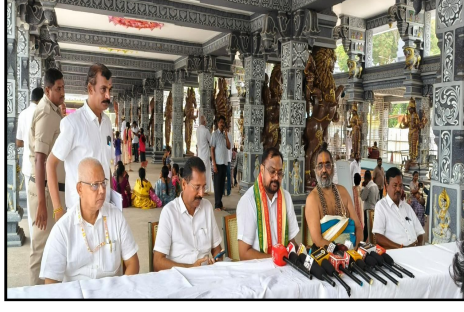
మీడియా సమావేశంలో మాట్లాడుతున్న అలయ ఈవో.