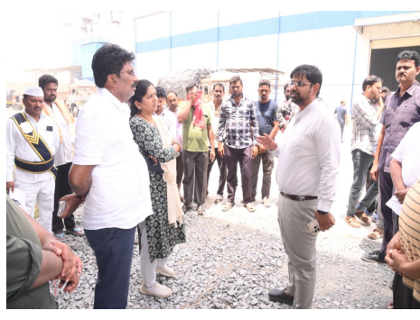
సంబంధిత రైతుల ఖాతాలలో 48 గంటలలో సగదు జమ చేయడం జరుగుతుందని, 3 రోజులలో ధాన్యం కొనుగోలు ప్రక్రియ పూర్తి చేసే దిశగా చర్యలు తీసుకుంటున్నామని తెలిపారు. మొక్కజొన్న పంట కొనుగోలు లక్ష్యం 8 వేల 700 మెట్రిక్ టన్నులు కాగా ఇకలా 3 వేల మెట్రిక్ టన్నుల పంట కొనుగోలు చేయవలసి ఉందని, 60 వేల మెట్రిక్ టన్నుల ధాన్యం రావలసి ఉందని తెలిపారు. గత సంవత్సరం జూన్ 6వ తేదీన ధాన్యం ప్రక్రియ పూర్తి కాగా ఈసారి మరింత ముందుగా పూర్తి చేసేందుకు చర్యలు తీసుకుంటున్నామని తెలిపారు.