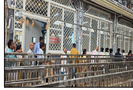
నూతన క్యూ కాంప్లెక్స్ లో భక్తులు.