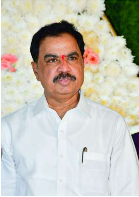
ప్రతి నెల మొదటి తేదీన పింఛన్ పంపిణీ కార్యక్రమం నిర్వహించడం ద్వారా లబ్ధిదారులకు ఆర్థిక భరోసా కల్పిస్తున్నట్లు అధికారులు పేర్కొంటున్నారు. గ్రామస్థుల సమక్షంలో పింఛన్ పంపిణీ చేపట్టి లబ్ధిదారులతో ఎమ్మెల్యే నేరుగా మాట్లాడనున్నారు.

నేడు ఆరాధనోత్సవంలో పాల్గొననున్న కళ్యాణదుర్గం ఎమ్మెల్యే అమిలినేని సురేంద్ర బాబు రానున్న రెండు రోజులలో పలు కార్యక్రమాల్లో పాల్గొననున్నారు. ప్రజలకు చేరువగా ఉంటూ సంక్షేమ, ఆధ్యాత్మిక కార్యక్రమాలకు ప్రాధాన్యత ఇస్తున్న ఎమ్మెల్యే అమిలినేని సురేంద్ర బాబు, మే 31 మరియు జూన్ 1 తేదీల్లో నిర్వహించే కార్యక్రమాలకు హాజరుకానున్నారు. ఈ మేరకు ఎమ్మెల్యే కార్యాలయం శనివారం ఒక ప్రకటన విడుదల చేసింది. ఆదివారం ఉదయం 8 గంటలకు నర్సూరు గుడికల్ అల్లీపీరా స్వామిల వారి 20వ ఆరాధనోత్సవ కార్యక్రమంలో ఎమ్మెల్యే పాల్గొననున్నారు. ఈ కార్యక్రమానికి వివిధ ప్రాంతాల నుంచి భక్తులు భారీగా తరలివచ్చే అవకాశం ఉందని నిర్వాహకులు తెలిపారు. ఆరాధనోత్సవంలో స్వామిల వారికి ప్రత్యేక పూజలు, భజనలు, ఆధ్యాత్మిక కార్యక్రమాలు నిర్వహించనున్న ఈ సందర్భంగా భక్తులతో, మరియు ప్రజల తో మమేకమై కార్యక్రమ నిర్వహణపై నిర్వాహకులను అభినందించనున్నారు. అనంతరం జూన్ 1వ తేదీ ఉదయం 8 గంటలకు తెట్లూరు మండలంలోని యర్రబోరపల్లె గ్రామంలో నిర్వహించే ఎన్టీఆర్ సామాజిక భద్రత భరోసా పింఛన్ పంపిణీ కార్యక్రమంలో ఎమ్మెల్యే పాల్గొననున్నారు. ప్రభుత్వం అమలు చేస్తున్న సంక్షేమ పథకాలలో భాగంగా అర్హులైన వృద్ధులు, వితంతువులు, వికలాంగులు మరియు ఇతర లబ్ధిదారులకు పింఛన్ పంపిణీ చేయనున్నారు.