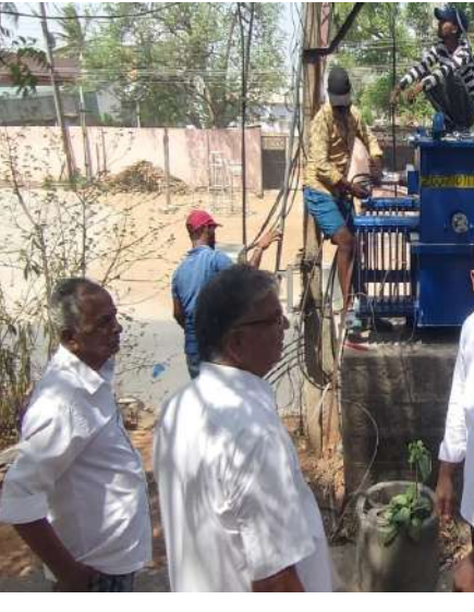
జనసముద్రం న్యూస్ / యాదాద్రి భువనగిరి ప్రతినిధి: