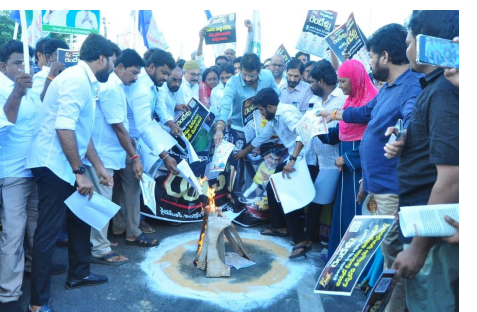
నెలకు 3000 రూపాయలు ఇస్తామని చెప్పి.. దానికి మంగళం పాడారన్నారు.

అలాగే నిరుద్యోగ భృతి.. కింద నిరుద్యోగులకు