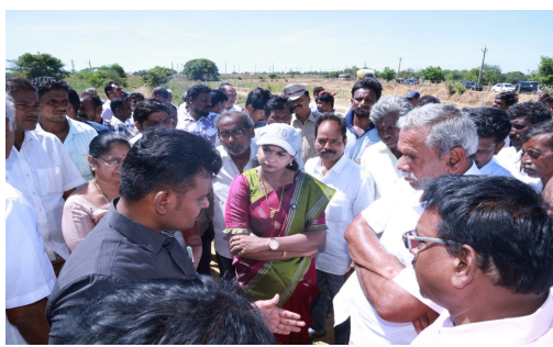
అనంతరం ప్రజలకు ఇబ్బందులు కలగకుండా తగిన చర్యలు తీసుకోవాలని అధికారులకు సూచించారు.

నెల్లూరు, జూన్ 6, జనసముద్రం జిల్లా ప్రతినిధి. ఉమ్మడి నెల్లూరు జిల్లా నూతనూరుపేట పట్టణ సమీపంలోని నెల్లూరుకాలవను శనివారం శాసనసభ్యురాలు డా. నెలవల విజయశ్రీ సంబంధిత ప్రభుత్వ అధికారులతో కలిసి సందర్శించి, కాలవ ప్రస్తుత పరిస్థితులను క్షేత్రస్థాయిలో పరిశీలించారు. ఈ సందర్భంగా కాలవ నిర్వహణ, నీటి ప్రవాహం, పరిసర ప్రాంతాల పరిస్థితులు మరియు ప్రజలకు ఎదురవుతున్న సమస్యలపై అధికారులతో సమీక్ష నిర్వహించి, అవసరమైన చర్యలు చేపట్టాలని అధికారులను ఎమ్మెల్యే విజయ శ్రీ ఆదేశించారు.