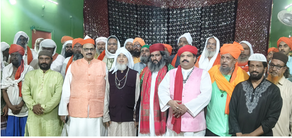
కొండపల్లి జూన్ 6: