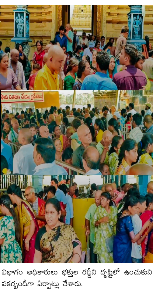
విభాగం అధికారులు భక్తుల రద్దీని దృష్టిలో ఉంచుకుని పక్కన ఉన్న దివ్యాంగులకు సౌకర్యం కల్పించారు.