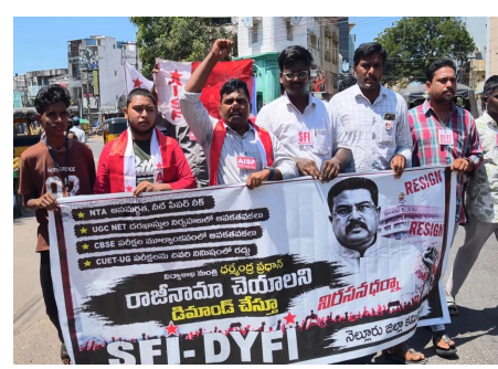
నిర్వహణలో పరుగులో పాలుబయటపడుతున్నట్లు నీట్ కేంద్ర ప్రభుత్వం ఎలాంటి సందర్భాల్లోనూ చేపట్టకుండా విద్యార్థులను అయోమయానికి గురి చేస్తోందన్నారు. నీట్ పరీక్ష పేపర్ లీక్ ఘటన దేశవ్యాప్తంగా లక్షలాది మంది విద్యార్థులు, తల్లిదండ్రుల్లో ఆందోళన కలిగించిందని, అయినప్పటికీ బాధ్యులపై కఠిన చర్యలు తీసుకోవడంలో ప్రభుత్వం విఫలమైందని విమర్శించారు. యూజీసీ-నెట్ దరఖాస్తుల ప్రక్రియలో సాంకేతిక సమస్యలు, పరీక్షల నిర్వహణలో గందరగోళం, సీబీఎస్ఈ మూల్యాంకనంలో వచ్చిన ఫిర్యాదులు, సీయూఈటీ-యూజీ పరీక్షలను చివరి నిమిషంలో రద్దు చేయడం వంటి చర్యలు విద్యార్థుల మానసిక