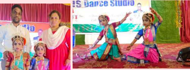
కల్వకుర్తి జనసముద్రం న్యూస్ జూన్ 8