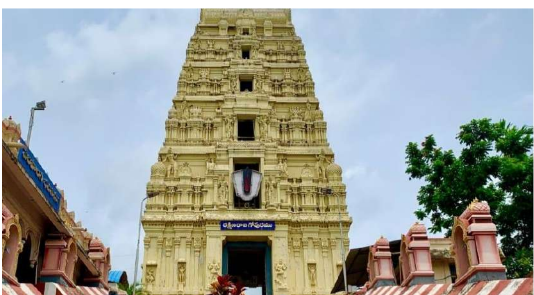
నిజానిజాలను భక్తుల ముందు ఉంచాలి' అని స్థానిక భక్తులు స్వామివారికి రావాల్సిన ఆదాయం భారీగా హరించుకోవోందని, మరెటు ప్రజా సలహాలు డిమాండ్ చేస్తున్నాయి. అర్చక లేని వారి చేతుల్లో అలయ పాలన ఉండటం వల్ల, ఆదోక్షలను ఉధృతం చేస్తామని స్థానికులు హెచ్చరిస్తున్నారు.

స్థానిక కథనం ప్రకారం, కవీసం పద్ తరగతి కూడా ఉత్తీర్ణులవ్వని వారు, ప్రైవేటు విద్యా సంస్థల ద్వారా పొందిన 'ఫేక్' డిగ్రీ సర్టిఫికేట్లను బి ఏ, బీకా సమర్పించి ఉద్యోగాల్లో చేరడమే కాకుండా, అంచెలంచెలుగా పదోన్నతులు పొందుతున్నారని ఆరోపణలు వస్తున్నాయి. అటెండర్ స్థాయి నుంచి ఉన్నత స్థాయిలకు ఎదిగిన కొందరు ఉద్యోగులు, డొంగ సర్టిఫికేట్లను చూపి అధికారులను బురిడీ కొట్టించారనేది స్థానిక ప్రధాన ఆరోపణ. ఈ వ్యవహారంపై గతంలో పలుమార్లు చర్యలు జరిగినప్పటికీ, ఉన్నతాధికారులు వాటిని పట్టించుకోకుండా, అక్రమాలకు పాల్పడిన వారిని కాపాడేందుకు ప్రయత్నిస్తున్నారని గ్రామస్థులు ఆవేదన వ్యక్తం చేస్తున్నారు. అసలైన విద్యార్థులకు అవకాశం దక్కకుండా, ఇలాంటి అసర్దులు అలభ్యతలో కీలకంగా మారడం వల్లనే నకిలీ డిగ్రీలు కుంభకోణం, ఆదాయం దారి మళ్లించడం వంటి అక్రమాల సులభంగా జరుగుతున్నాయని విశ్లేషకులు భావిస్తున్నారు. భక్తల డిమాండ్ 'స్వామివారి సామ్యం, ఆలయ పవిత్రతను కాపాడాలి'న వారే ఇలాంటి అక్రమాలకు పాల్పడటం అత్యంత దారుణం. తప్పదు సర్టిఫికేట్లతో పదవుల్లో ఉన్న వారిని వెంటనే గుర్తించి, వారిపై కఠిన చర్యలు తీసుకోవాలి. సంబంధిత ఉన్నతాధికారులు స్వతంత్ర విచారణ చేపట్టి,