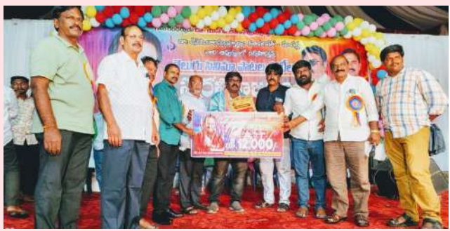
జనసముద్రం న్యూస్, మాచర్ల, జూన్ 8 :