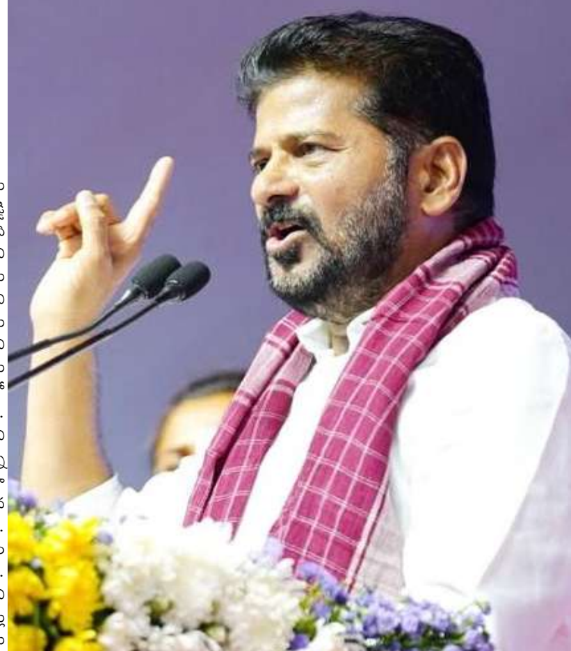
రూ.161కోట్లతో సైబరాబాద్ మున్సిపల్ కార్పొరేషన్ ప్రధాన కార్యాలయ నిర్మాణానికి సిఎం శంకుస్థాపన చేశారు. రూ.530కోట్లతో మియాపూర్ చౌరస్తాలో పై ఓవర్ నిర్మాణ పనులకు భూమిపూజ చేశారు. అలాగే రూ.308కోట్లతో శేరిలింగంపల్లి ఆరోపి నిర్మాణ పనులకు కొబ్బరికాయ కొట్టారు.