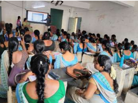
సిడిపిఓ పరిమళ తిరిపాడు ఈ సందర్భంగా అంగన్వాడీ

దాసకొండ, జూన్ 9 :జన సముద్రం స్యూస్ ప్రతినిధి: (జి అశోక్)