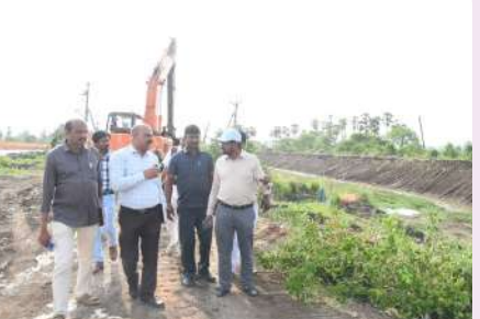
విద్యుత్ ప్రంభాలు ఉండటం వల్ల పూడికను తీసి కట్టపై వేరుదండలో ఇబ్బందులు ఎదురవుతున్నాయని, దీంతో పనుల పురోగతి మందగిస్తోందని అధికారులు ఆయన దృష్టికి తీసుకువచ్చారు. దీనిపై స్పందించిన కలెక్టర్ వెంటనే విద్యుత్ శాఖ అధికారులతో ఫోన్లో మాట్లాడి, విద్యుత్ ప్రంభాల లైనుకోవాలని ఆదేశించారు. పనులకు ఎటువంటి అటంకాలు లేకుండా చూసుకుని పూడికతీత కార్యక్రమాన్ని వేగవంతం చేసి నిర్మిత సమయంలో పూర్తి చేయాలని సంబంధిత అధికారులకు సూచించారు. కలెక్టర్ వెంటనే శాఖ ఈ కేరీ, ఇంజనీరింగ్ కలెక్టర్ పరిశీలించారు. డ్రైనేజీ కట్ట లోపల దిగువన

జనసముద్రం స్యూస్ పాపూర్తి నియోజవర్గం ప్రతినిధి.