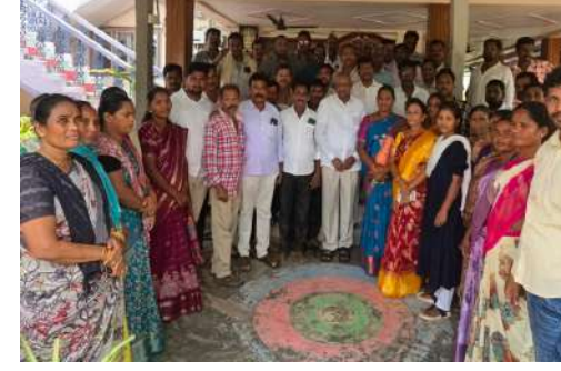
పెద్ద సంఖ్యలో ఈ సమావేశంలో పాల్గొని పార్టీ అభివృద్ధి, ప్రభుత్వ పథకాల అమలు గురించి తమ అభిప్రాయాలు, సూచనలు వెల్లడించారు.