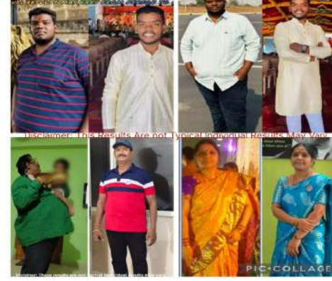
హ్యూరీ వివరాలకు ఈ సెల్ నెంబర్ వారితో సంప్రదించగలరు. 9441840804 ఆరోగ్యమే మహాభాగ్యము

•వీప్ ఉమ్మడి ఖమ్మం జిల్లా. ఆరోగ్యంగా బరువు తగ్గాలి అన్నా బరువు పెరగాలి అన్నా కండ శాస్త్రాన్ని పెంచుకోవాలి అన్నా పిల్లలకు పౌష్టికాహారం పెద్దవారి కూడా పౌష్టికాహారం అలాగే మన స్వీట్ బాగుండాలి అన్నా న్యూట్రిషన్ కావాలి అలాగే మా దగ్గర రోజు జుండా వర్కౌట్ ఉంటాయి అలాగే మన శరీరానికి రోజు పౌష్టిక ఆహారం ఇవ్వాలి దీనివలన రోజు మనకి కావలసిన విటమిన్స్ మినరల్స్ అందుతాయి దీనివలన మనము రోజు ఆరోగ్యంగా ఉండవచ్చు జీవితాంతం ఆస్పత్రి కి వెళ్లకుండా ఆరోగ్యంగా ఉండవచ్చు మనము ఎప్పుడైతే బాడికి పౌష్టిక ఆహారం ఇవ్వడం వలన ఆరోగ్యంగా బరువు తగ్గ వచ్చు బరువు పెరగవచ్చు ఆరోగ్యమైన స్వీట్ ని మొయిలైన్ చేయవచ్చు. ఈ విధంగా ఆరోగ్య సూత్రాలు పాటించి ఊబకాయం నుండి నన్ను గా మారిన వారిని పై ఫోటోలో ఉన్న వారిని పరిశీలించండి.