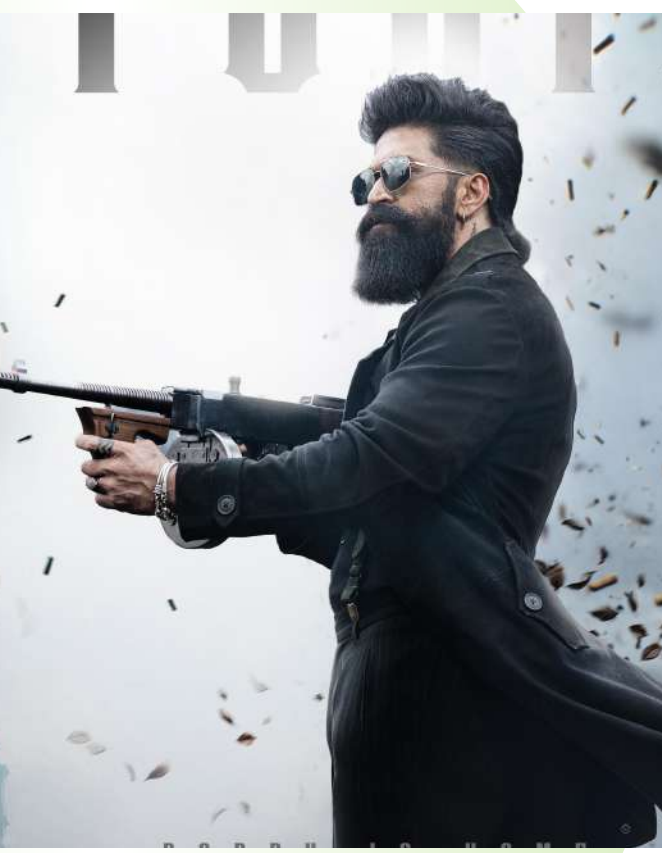
దసరాకు షిప్ అయిన టాక్సిక్ విడుదల చిత్ర పర్సాల్లో బలమైన టాక్

కన్నడ రాకింగ్ స్టార్ యష్ హీరోగా తెరకెక్కుతున్న భారీ పాన్ ఇండియా చిత్రం 'టాక్సిక్' గురించి మరోసారి ఆసక్తికర వార్తలు సినీ పర్సాల్లో చక్కర్లు కొడుతున్నాయి. కేటీవీ సినీసితో దేశవ్యాప్తంగా సంవలన క్రేజ్ సంపాదించుకున్న యష్ నుంచి వస్తున్న తదుపరి సినిమా కావడంతో ఈ ప్రాజెక్టుపై ప్రేక్షకుల్లో భారీ అంచనాలు నెలకొన్నాయి. అయితే సినిమా విడుదల తేదీ విషయంలో మాత్రం ఇంకా స్పష్టత రాకపోవడంతో అభిమానుల్లో ఉత్సాహం కొనసాగుతోంది. ప్రతిభావంతురాలైన దర్శకురాలు గీతూ మోహన్ దాస్ తెరకెక్కిస్తున్న ఈ చిత్రంలో యష్ సరసన రుక్మిణి వసంత్, తారా సుతారియా నటిస్తుండగా, కీలక పాత్రల్లో హుమా ఖురేషి, కిరారా అద్వానీ, నయనతార కనిపించనున్నారని సమాచారం. భారీ తారాగణం, హై బడ్జెట్ నిర్మాణ విలువలతో రూపొందుతున్న ఈ సినిమా మొదటి నుంచే దేశవ్యాప్తంగా చర్చనీయాంశంగా మారింది. అయితే ఈ చిత్రం ఇప్పటికే విడుదల కావాల్సి ఉన్నప్పటికీ, మేకర్స్ సరైన సమయాన్ని ఎంపిక చేసుకునే ప్రయత్నంలో ఉన్నట్లు తెలుస్తోంది. మార్కెట్ పరిస్థితులు, ఇతర పెద్ద సినిమాల విడుదలలు, పాన్ ఇండియా స్థాయిలో బిజినెస్ అవకాశాలు వంటి అంశాలను పరిగణనలోకి తీసుకుని విడుదలను వాయిదా వేస్తున్నారని ఇండస్ట్రీ వర్గాలు చెబుతున్నాయి. తాజాగా సమాచారం ప్రకారం 'టాక్సిక్' సినిమా ఈ ఏడాది అక్టోబర్ నెలకు షిప్ అయ్యే అవకాశాలు ఉన్నాయట. ముఖ్యంగా అక్టోబర్ తొలి వారం లేదా మూడో వారంలో విడుదల చేయాలని మేకర్స్ ఆలోచిస్తున్నట్లు కన్నడ సినీ పర్సాల్లో ప్రచారం జరుగుతోంది. ప్రస్తుతం ఈ వార్త సోషల్ మీడియాలో వైరల్ అవుతుండగా, అభిమానులు అధికారిక ప్రకటన కోసం ఎదురుచూస్తున్నారు. ఇప్పటి వరకు చిత్ర బృందం నుంచి రిలీజ్ డేట్పై ఎలాంటి అధికారిక ప్రకటన రాలేదు. దీంతో ఈ వార్తల్లో ఎంతవరకు నిజం ఉందనేది తెలియాలి ఉంది.