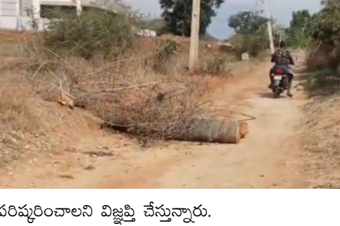
పరిష్కరించాలని విజ్ఞప్తి చేస్తున్నారు.

జనసముద్రం న్యూస్, మదనపల్లి, జూన్ 10:- మదనపల్లి మండలం, మాలేపాడు లో బుధవారం దారి సమన్వయ మళ్లీ మొదలైంది. టిడిపిలోని రెండు వర్గాల మధ్య గోడవ తారాస్థాయికి చేరింది. దీంతో వారు ఒకరిపై మరొకరు పోటీపడి 13 పల్లెలకు వెళ్లే ప్రధాన రహదారిని చెట్ల మొద్దులు, ముళ్ళకంపలు రోడ్డుకు అడ్డంగా వేసి రాకపోకలను స్తంభింప చేశారని అక్కడి గ్రామాల బాధిత ప్రజలు ఆరోపిస్తున్నారు. జిల్లా కలెక్టర్, ఎస్పీలు స్పందించి రోడ్డు సమన్వయ శాశ్వతంగా