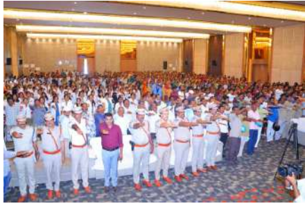
రహదారిపై ఎక్కడైనా ప్రమాదం జరిగితే, ఫోన్లో వీడియోలు తీస్తూ కాలయాపన చేయకుండా.. వెంటనే అంబులెన్స్కు సమాచారం అందించాలి. బాధితులకు మానవత్వంతో సహాయం చేస్తూ, అవసరమైతే సీపీఆర్ చేసి ప్రాణాలు కాపాడే బాధ్యతాయుతమైన పౌరులుగా మెలగాలని కోరారు. ప్రతి ఒక్కరూ సురక్షితంగా ఇళ్లకు చేరాలని కోరారు. ప్రతి ఒక్కరూ సురక్షితంగా ఇళ్లకు చేరాలని కోరారు. ప్రతి ఒక్కరూ సురక్షితంగా ఇళ్లకు చేరాలని కోరారు.